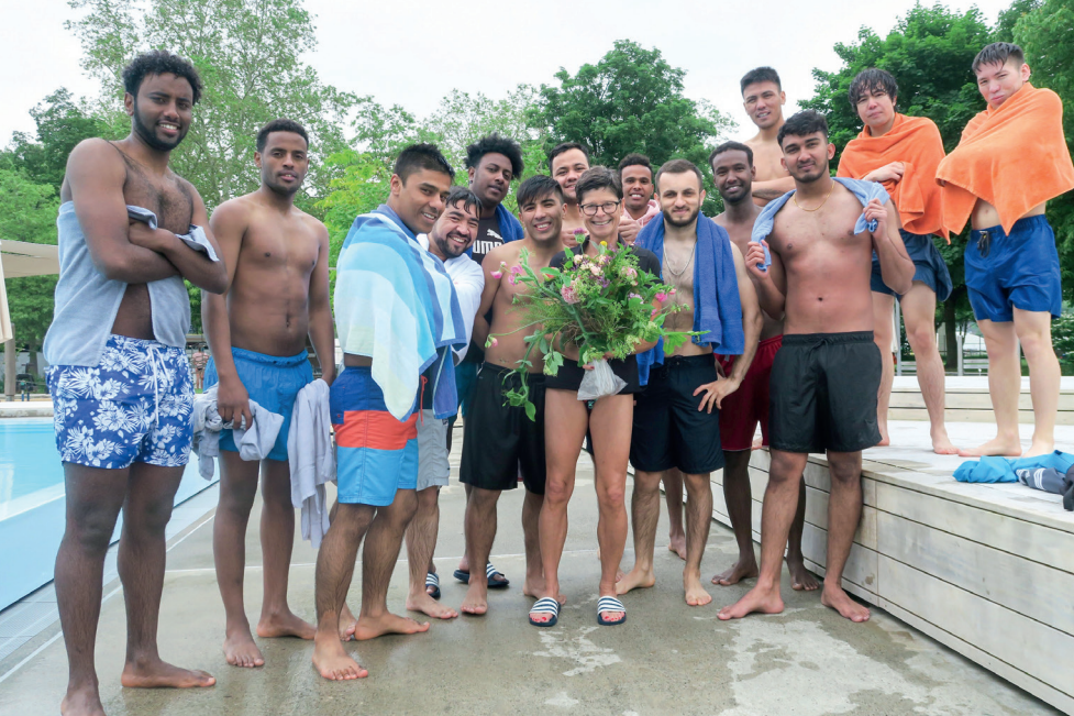
Der Schwimmunterricht kann als voller Erfolg gewertet werden.