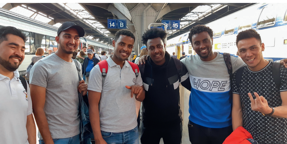
Ein weiteres Phänomen nicht physikalischer Art: Die Rückreise von Winterthur nach Aarau. Das Bild oben zeigt die ganze Klasse nach dem Besuch des Technorammas. Die Ankunft in Aarau dokumentiert folgendes Bild: Sechs Personen!