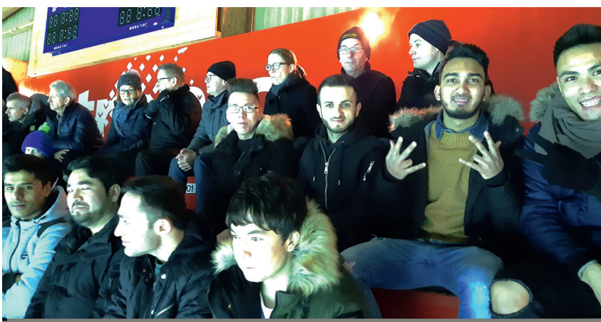
Auch der Besuch eines Eishockeyspiels stand auf dem Programm.

Um es gleich vorweg zu nehmen, von 17 gestarteten Lernenden haben nach dem ersten Jahr der In-