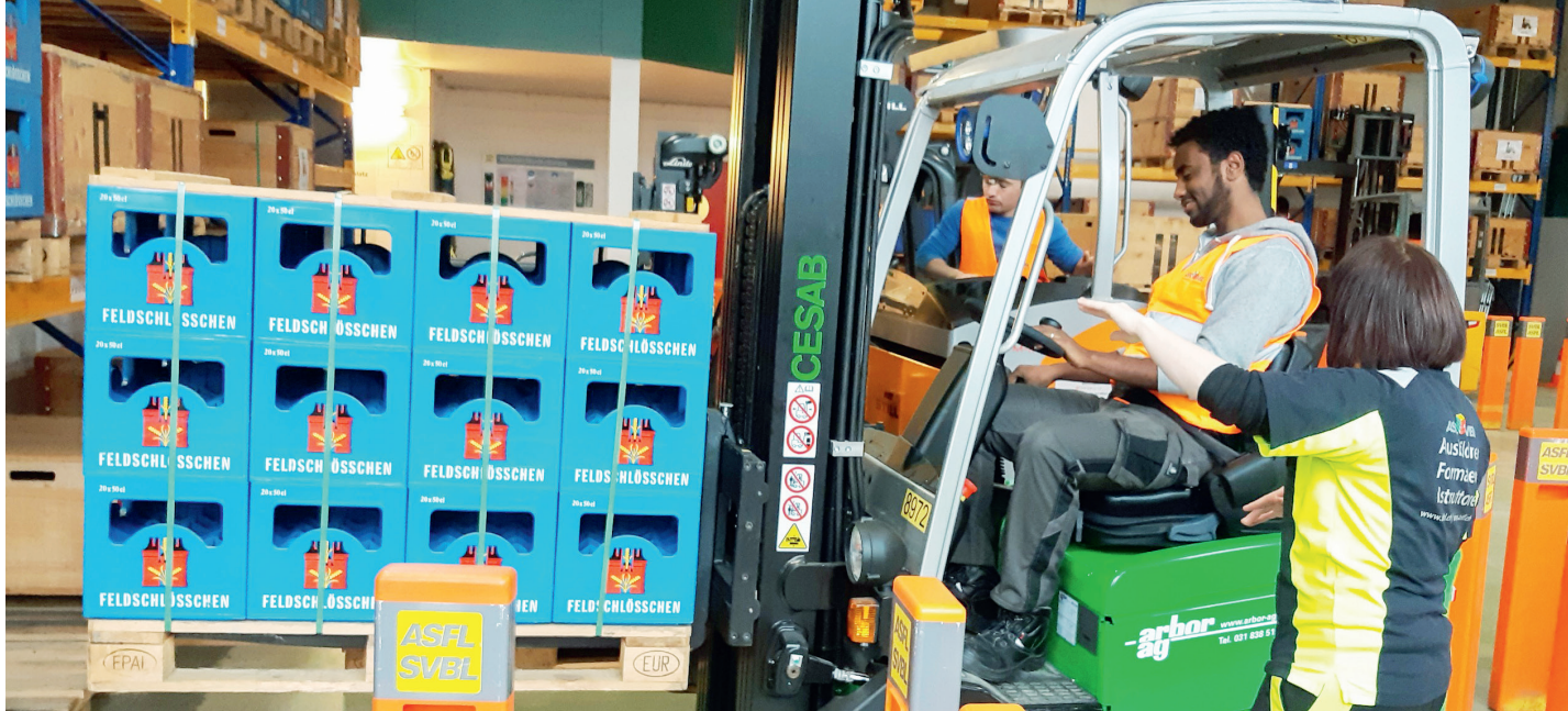
Während eines Staplerkurses bei der ASFL SVBL.

Ein weiterer Höhepunkt war der Besuch des Technorama in Winterthur. Physikalische Phänomene selber erleben und erproben zu können, war völlig neu für die Lernenden, die allesamt aus Entwicklungsländern stammen. So war es nicht erstaunlich, dass das Interesse an Technologie und Physik und damit die Experimentierfreude sofort geweckt war.