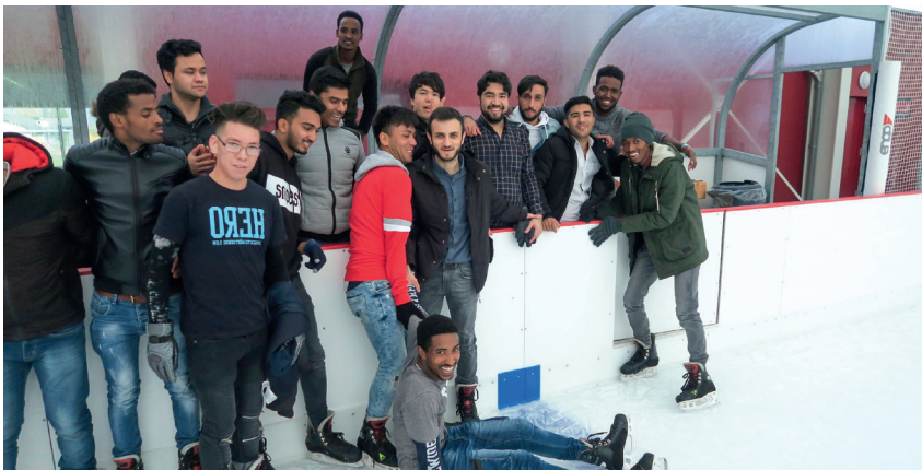
Für die meisten Lernenden war es das erste Mal auf den Schlittschuhen.