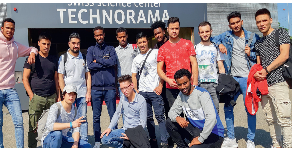
Die ganze Klasse nach dem Besuch des Technorammas.